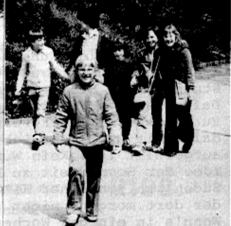
Jugendchor GZ * Reise